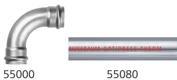
Fig. 5: Coude Optipress-Therm 90° et tuyau Optipress-Therm

Nussbaum recommande Optipress-Therm surtout pour l'intérieur.