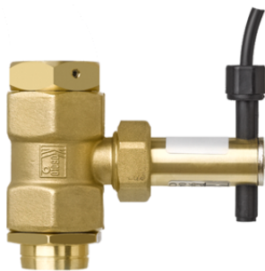
23336 - Flussostato, per disgiuntore di rete BA/CA con raccordi