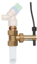
23335 - Flussostato, per valvola di sicurezza