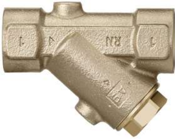
17011 - Filtre oblique