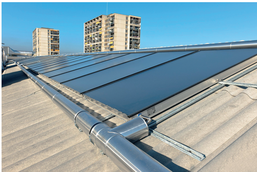
Fig. 7: Installazione di un impianto solare a collettori piatti sul tetto con Optipress.

L'esempio seguente mostra un impianto solare a collettori piatti con un'inclinazione di 20° e una superficie dei collettori di 140 m 2 con raccordo a tubi in acciaio inossidabile 1.4520 Optipress isolati e fitting Optipress-Aquaplus.