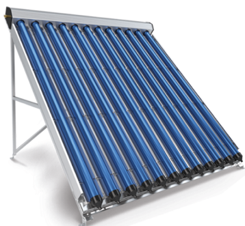
Fig. 3: Collettore tubolare sottovuoto.

Rispetto ai collettori termici piatti, i collettori tubolari sottovuoto necessitano di meno spazio a fronte di prestazioni equivalenti e vantano un livello di rendimento più elevato.