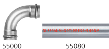
Fig. 5: Optipress-Therm-Curva 90° e Optipress-Therm-Tubo.

La Nussbaum raccomanda l'impiego di Optipress-Therm principalmente per applicazioni in ambienti interni.