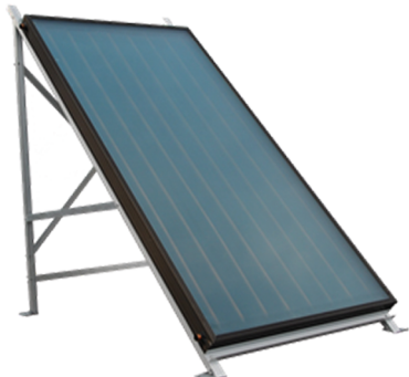
Fig. 2: Collettore termico piatto.

Un collettore termico piatto è caratterizzato da un'altezza d'ingombro particolarmente ridotta. Sotto la piastra captante si trova un sistema di tubazioni attraverso il quale scorre il liquido termovettore. Come liquido termovettore viene utilizzata una miscela di acqua e antigelo. L'aggiunta di antigelo serve ad assicurare che, a temperature inferiori allo zero, l'acqua non congeli e l'impianto non subisca relativi danni. Per l'isolamento termico vengono impiegati isolanti convenzionali.