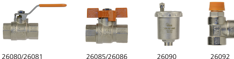
Fig. 6: Rubinetteria per temperature elevate della Nussbaum.