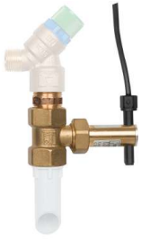
23335 - Contacteur de protection du débit d'écoulement, pour soupape de sûreté