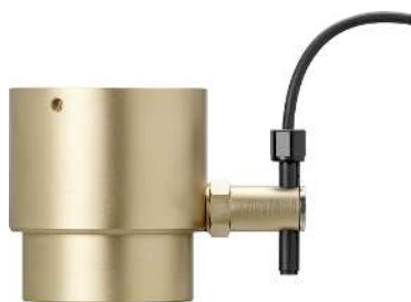
23337 - Flussostato, per disgiuntore di rete BA con flange