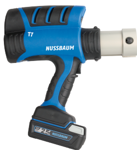
83100 - Pince à sertir type 7