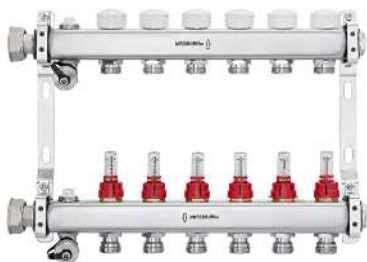
56040 - Therm-Control-Collettore di riscaldamento, per riscaldamento a pavimento e attivazione termica delle masse