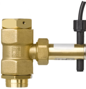
23336 - Strömungskontrollschalter, zu Systemtrenner BA/CA mit Anschlussverschraubungen