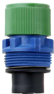
93001 - Tête de soupape de sûreté, réglage fixe à 6 bar