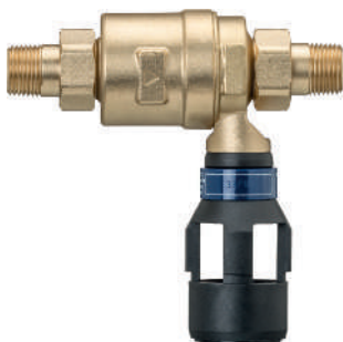
15090 - Disgiuntore di rete CA, con raccordi