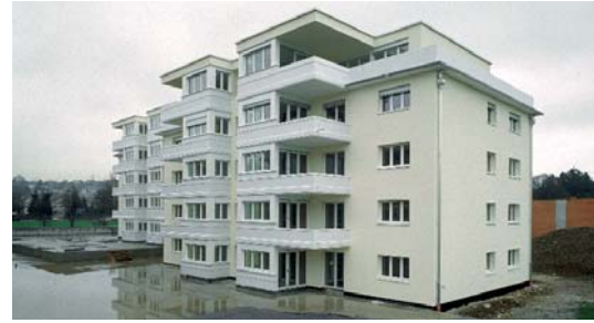
An der Peripherie der Stadt Wil sind 45 Eigentumswohnungen entstanden. Schon im Rohzustand waren 30 Wohnungen verkauft.