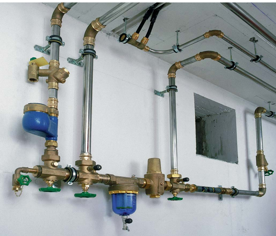
Nussbaum Installationssysteme und Armaturen, vom Wassereintritt ins Gebäude bis vor die Auslauf-Armaturen.