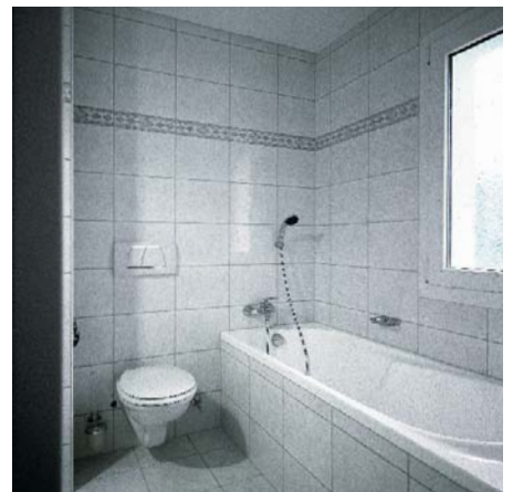
In sämtlichen Nasszellen der Überbauung kam das flexible Vorwandsystem Optivis zum Einsatz.