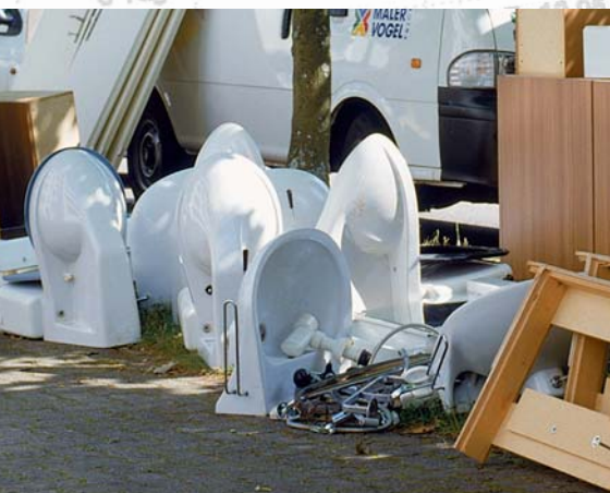
Die alten Einbauküchen, Lavabos, Badewannen und WCs wurden einer gemeinnützigen Organisation für den Abtransport nach Bosnien übergeben.

Erwähnenswert ist eine Aktion der Bauherrschafft, die die alten Einbauküchen, Lavabos, Badewannen und WCs sorgfältig ausbauen liess und einer gemeinnützigen Organisation übergab. Diese transportierte das Material nach Bosnien, wo viele Leute froh sind über so gut erhaltene Artikel.