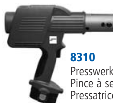
8310 Presswerkzeug Typ 4 A Pince à sertir type 4 A Pressatrice tipo 4 A