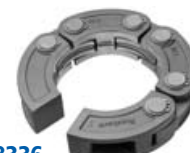
8336 Optipress-XL-Presskette Optipress-XL-Chaîne à sertir Optipress-XL-Collare