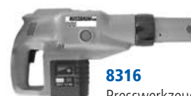
8316 Presswerkzeug Typ 3 A Pince à sertir type 3 A Pressatrice tipo 3 A