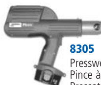
8305 Presswerkzeug Picco Pince à sertir Picco Pressatrice Picco