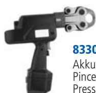
8330 Akku-Presswerkzeug Pince à sertir-accu Pressatrice-accu