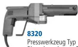
8320 Presswerkzeug Typ 2 Pince à sertir type 2 Pressatrice tipo 2

La manutenzione comprende lo smontaggio, la pulizia, la sostituzione dei pezzi di ricambio soggetti ad usura, il cambio dell'olio, il successivo montaggio ed il controllo del funzionamento.