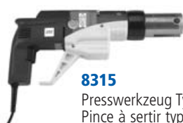
8315 Presswerkzeug Typ 3 Pince à sertir type 3 Pressatrice tipo 3