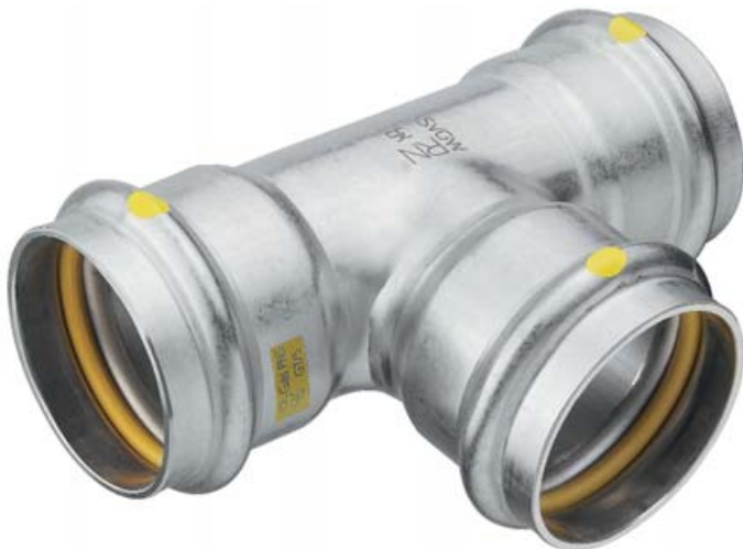
Der Optipress-Gaz-Pressfitting von Nussbaum // Le raccord à sertir Optipress-Gaz de Nussbaum // Il pressfitting Optipress-Gaz della Nussbaum

Non vi è alcun rischio di scambio – i componenti del sistema Optipress-Gaz sono contrassegnati su entrambi i lati con una dicitura gialla, dotati di guarnizione HNBR gialla e imballati in un'unità d'imballaggio gialla.