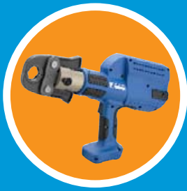
Presswerkzeug mit Pressbacke // Pince à sertir avec mâchoire // Pressatrice con ganaschia