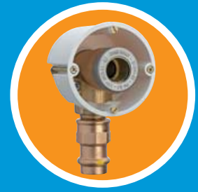
Steckdose // Prise pour gaz à montage caché // Scatola di raccordo