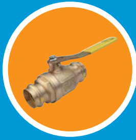
Kugelhahn // Robinet à bille à sertir // Rubinetto a sfera