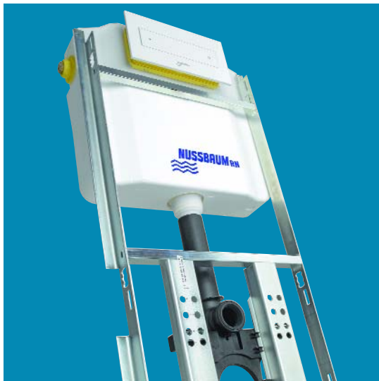
Optivis-Tec-Spülkasten Optivis-Tec-Réservoir de chasse Optivis-Tec-Cassetta ab Seite / dès page / da pagina 408*