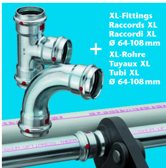
XL-Fittings Raccords XL Raccordi XL Ø 64-108 mm + XL-Rohre Tuyaux XL Tubi XL Ø 64-108 mm