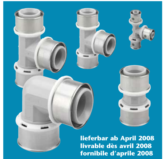
lieferbar ab April 2008 livrable dès avril 2008 fornibile d'aprile 2008