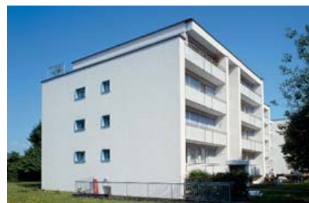
Il complesso residenziale di 4 piani «Rhyblick» a Sisseln/AG.