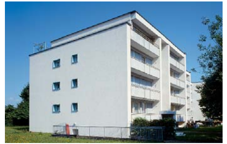
Le bloc d'habitation de 4 étages «Rhyblick» à Sisseln/AG.